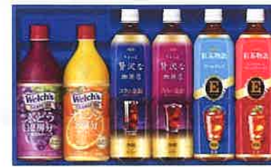
★AGFファミリー飲料ギフトLR-30