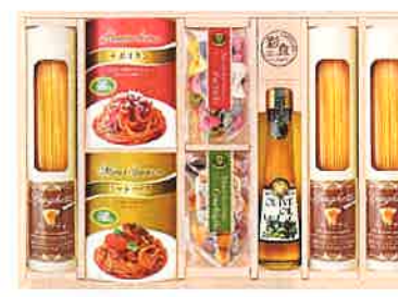
★彩食ファクトリー パスタセットPHF-EJR