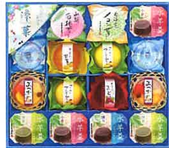
★金澤兼六製菓 涼菓