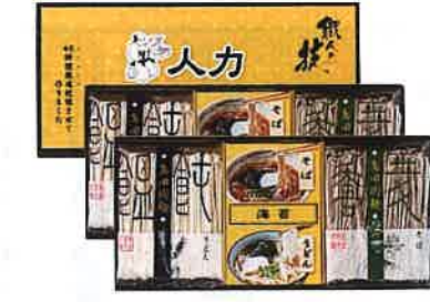
★人カうどん「職人の技」 うどん・そばセットJUS-CO