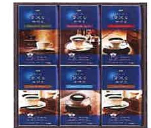
★AGF ドリップコーヒーギフト