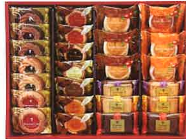
★nakayama カフェスマイルセット