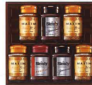
★AGF コーヒーバラエティギフト