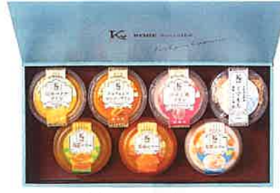
★神戸シュクレテ プリン・ゼリー詰合せ