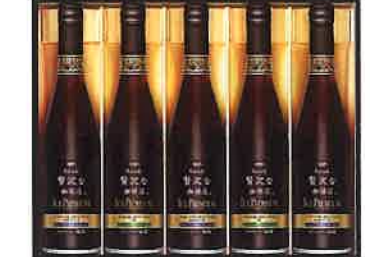
★AGF ちょっと贅沢な珈琲店 アイスプレミアムギフト