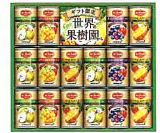
★デルモンテ 世界の果樹園から プレミアム飲料ギフトWFF-30R