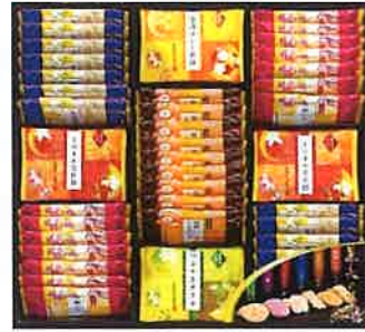
★金澤兼六製菓 兼六の華