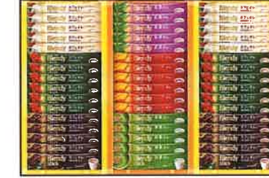
★AGF プレنديスティック カフェオレコレクション