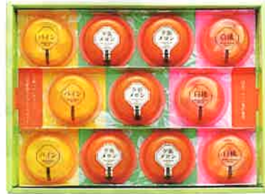
★北辰フーズゼリーコレクション