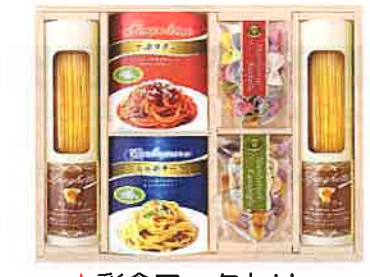
★彩食ファクトリー パスタセットPHF-CJR