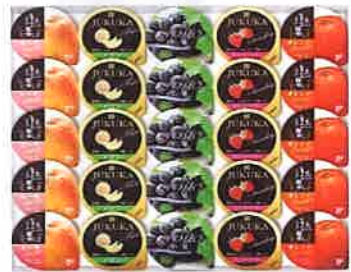
★巨峰ゼリー&熟果ゼリープレミアム

※商品1個につき送料660円(税込)が含まれています。 ※発送はご注文確認の後、7～10日ほどかかります。 ※都合により品切れとなる場合がございますので予めご了承ください。 ※★印の商品は軽減税率対象商品です。 ご注文先 大分県労働福祉会館 TEL 097-533-1121 FAX 097-533-2130