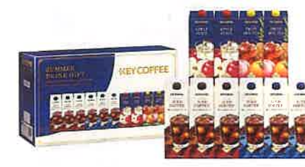
★キーコーヒードリンクギフト