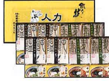
★人カうどん「職人の技」 うどん・そばセットJUS-EO