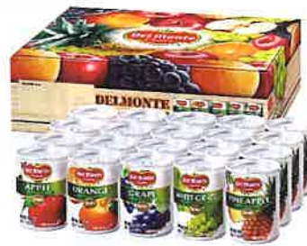
★デルモンテ スマートパッケージ 100%果汁飲料ギフト