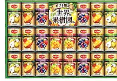
★デルモンテ 世界の果樹園から プレミアム飲料ギフトWFF-50R